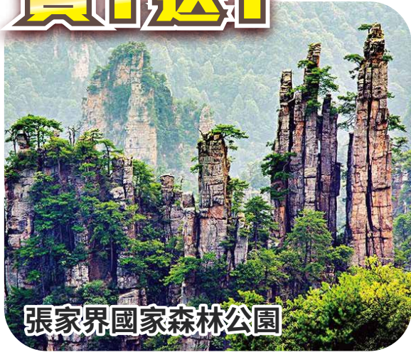
張家界國家森林公園