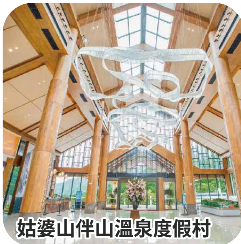
姑婆山伴山溫泉度假村