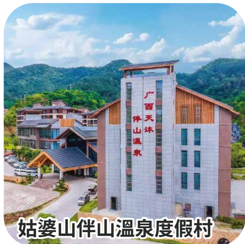
姑婆山伴山溫泉度假村

天數 早餐 午餐 晚餐 宵夜 地區 酒店 1 三水人家宴 溫泉風味宴 酒店宵夜 賀州 姑婆山伴山溫泉度假村 ◆◆◆◆◆ 4.4/5 1010則評價· "空氣清新、溫泉舒適" 2 酒店 姑婆山農家風味宴 溫泉風味宴 酒店宵夜 3 酒店 懷集農家宴