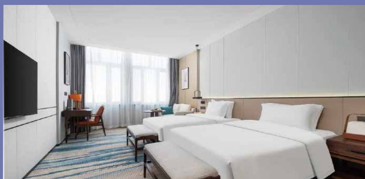
奎屯天北新區雲居酒店