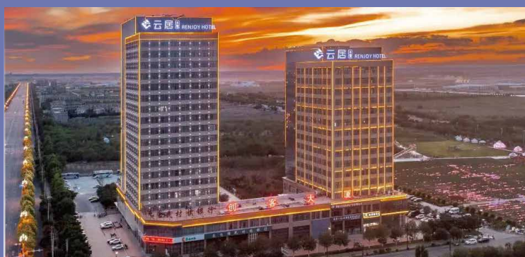
奎屯天北新區雲居酒店