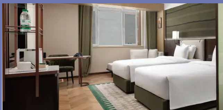
烏魯木齊溫德姆花園酒店