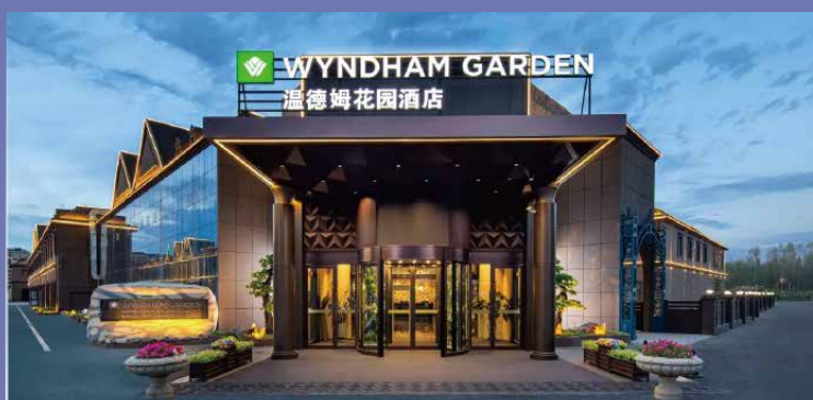
烏魯木齊溫德姆花園酒店