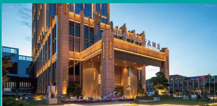
海寧瑞萊克斯大酒店