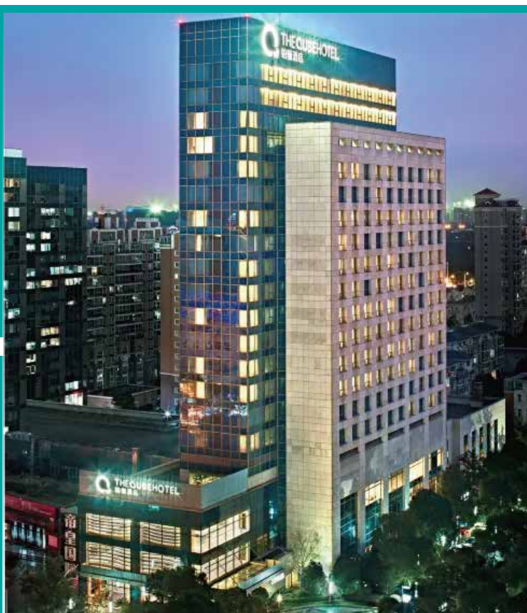
上海南橋綠地鉅驪酒店