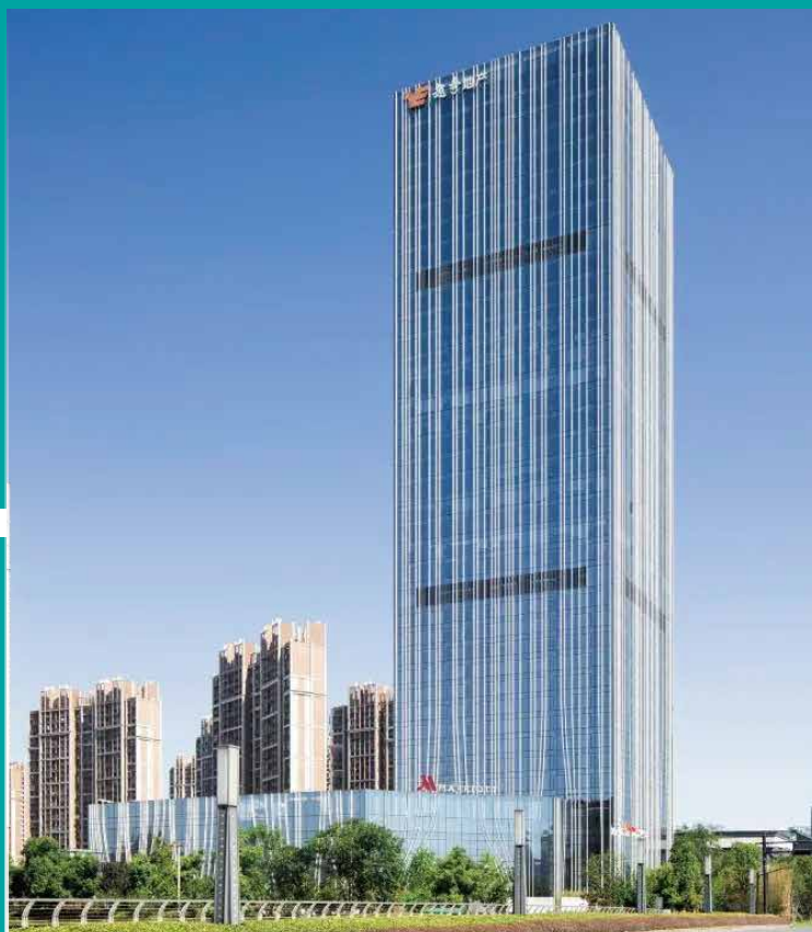
杭州臨安萬豪酒店