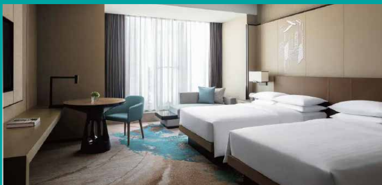
杭州臨安萬豪酒店